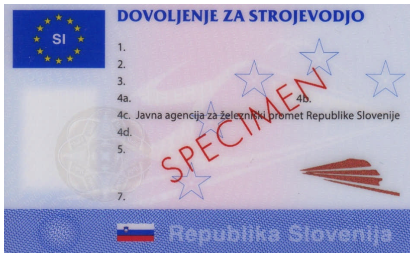
Vzorec dovoljenja – sprednja stran