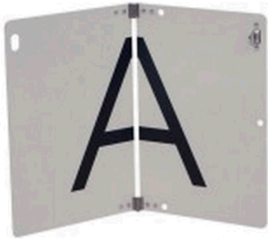
Slika 2 Preklopna tabla