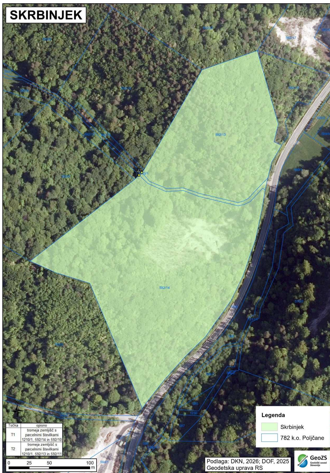
Priloga 2: Situacijski načrt pridobivalnega prostora Skrbinjek na katastrski in topografski podlagi