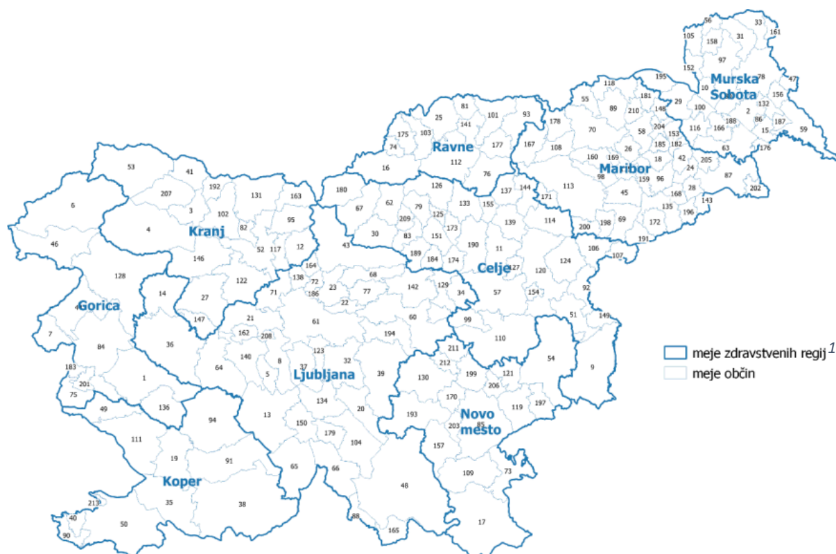
Slika 2: Zemljevid Slovenije z območnimi enotami NIJZ