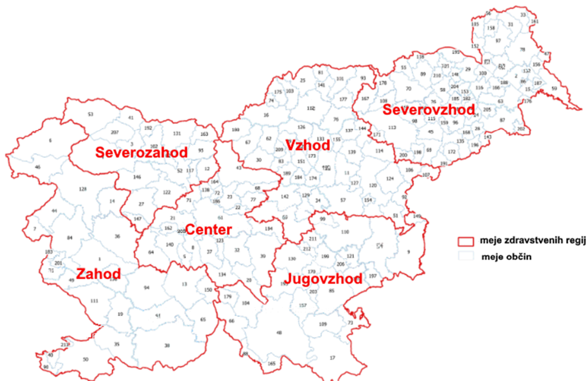
Slika 4: Zemljevid Slovenije po zdravstvenih regijah