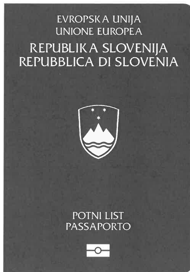
zunanja stran prednje platnice