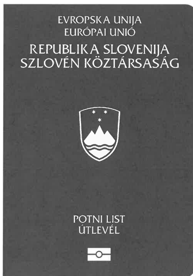
zunanja stran prednje platnice